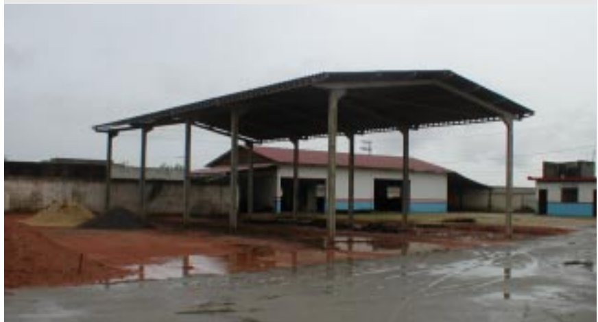
Die neu erstellte Halle im Rohbau